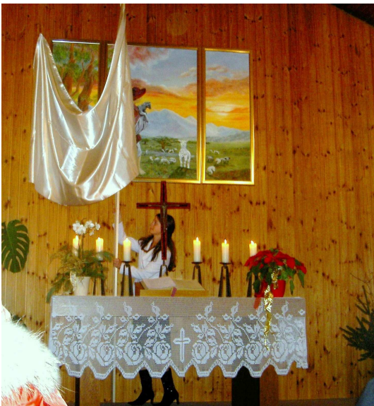
Während der Enthüllung

Beim anschließenden Sektempfang konnten sich die Besucher über die Entstehung des Bildes anhand von ausgestellten Fotos informieren.