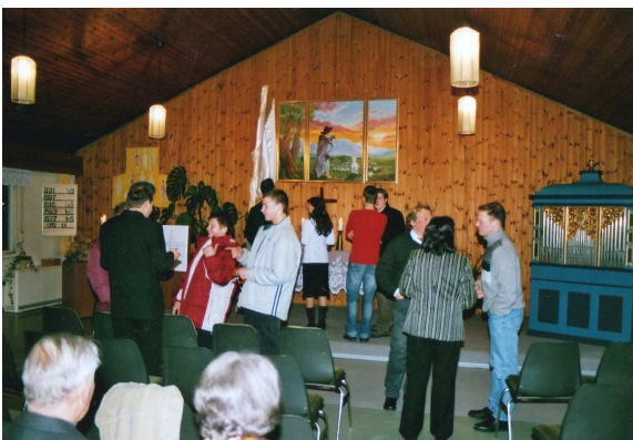
Beim anschließenden Sektempfang